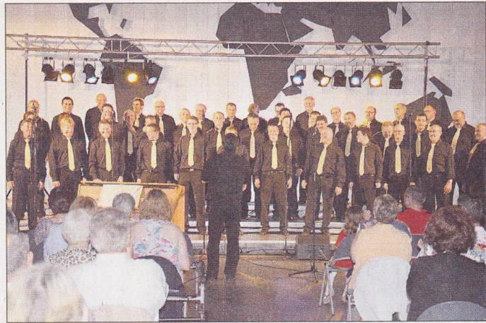
Die Gastgeber: Der moderne Chor des MGV Hermersberg „Frohsinn Light“